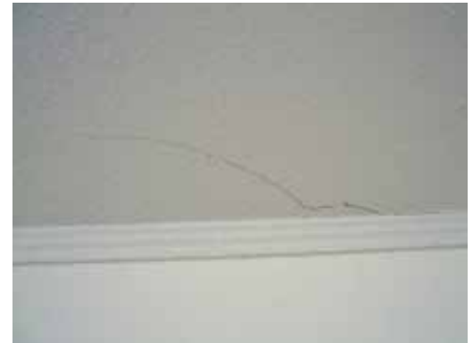
1 . Fisura en cielos (No presenta peligro para los habitantes)

La aparición de estas fisuras no debe preocuparlo, pues está previsto que ocurran. Sin embargo, si reviste un problema estético para Usted le recomendamos proceder a disimular la fisura al cabo de un tiempo prudente de que aparezca, y así evitar tener que repetir el proceso, pues esta liberación de tensiones y asentamiento de los distintos materiales es un proceso que demora alrededor de 3 años en terminar luego de construido el edificio.