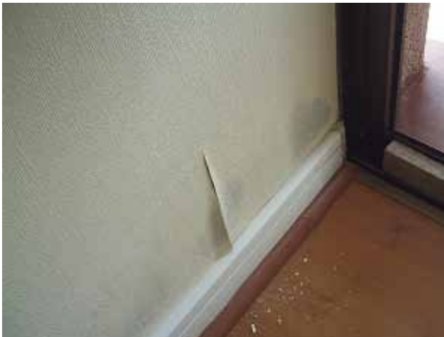
6. Papel despegado y con hongos producto de condensación, humedad y mala ventilación.

El fabricante de papel mural garantiza el producto durante 1 año por defectos en su fabricación.