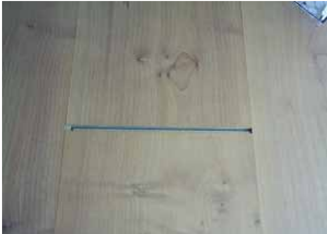
4. Separación de tablas producto del uso, sin la debida precaución y sin la debida precaución y mantenimiento.

El fabricante de piso flotante garantiza el producto durante 1 año por defectos de fabricación.