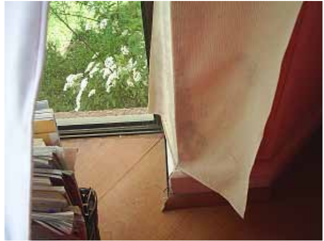
7. Daño mayor en papel mural producto de humedad, condensación y mal mantenimiento de la propiedad.