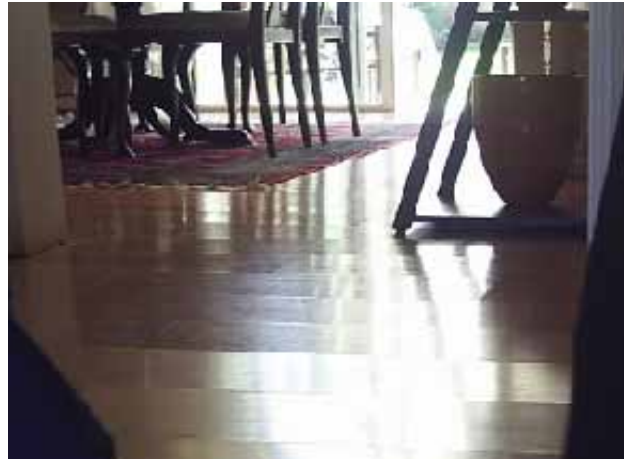
5. Piso fotolaminado levantado en las uniones producto del exceso de productos de limpieza y humedad.